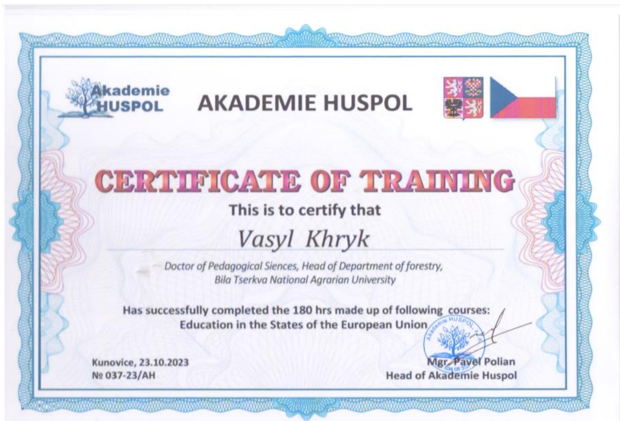
Міжнародне стажування у HUSPOL Academy, Чехія